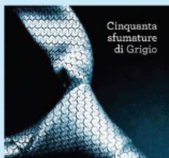
Cinquanta sfumature di Grigio

Cresce l'attesa per l'arrivo nelle sale italiane il prossimo febbraio, della trasposizione cinematografica del romanzo cult "50 sfumature di grigio" dalla scrittrice inglese E. L. James. Ma i fan potrebbero rimanere delusi perché l'attore 32enne Jamie Dornan che interpreta Christian Grey non apparirà con il nudo frontale. L'attore e modello ha rivelato una clausola segreta del suo contratto firmato prima di girare il film. Nella clausola si vieta il "nudo frontale" del protagonista che, invece, viene descritto nel libro. Un divieto che trova d'accordo lo stesso Dornan che non intende proporre nulla di spinto.